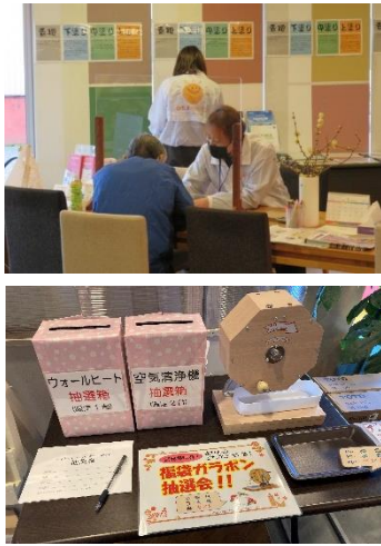
お越しいただきありがとうございました！ ガラポン抽選も楽しんで頂きました♪

今年初めての企画のもと1月14日(土)・15日(日)の2日間限定で初売り・お年玉キャンペーンを開催しました。当日は両日とも寒い雨にもかかわらず、ご家族で多くのお客様にお越しいただき、ガラポン抽選や干支の「うさぎ」の銘菓などお持ち帰りいただきました。