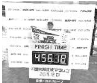
松江マラソン 12/1 完走の様子