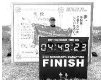
加古川マラソン 12/22 完走の様子