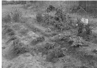
湯梨浜の浜畑 水やり後