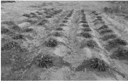
湯梨浜の浜畑の様子

また、開墾したばかりの時は砂地でもあり、「生き付いてくれるのか？」と心配でほぼ毎日仕事が終わってから水やりに通っています。砂地は水はけが良過ぎて、通常の土地の5倍以上水をあげても、すぐさま乾ききってしまい、心配の連続でした。