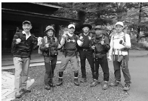
上高地白樺荘早朝5時出発