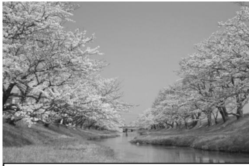
淡いピンクの花々と爽やかな青空がまぶしいです

こんにちは、松本です。いよいよ4月。春が来ましたね。まわりを見渡せば春の訪れが花、草や風、天候、気温と感じることが出来る穏やかな日々ですね。