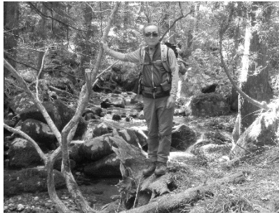
那岐山 西仙コースのせせらぎ